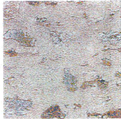
Enduit à pierres vues

Les joints doivent être bien pleins et exécutés à fleur de parement ; ils pourront être lissés (joints beurrés à l'ancienne), brossés ou grattés, selon l'aspect recherché.