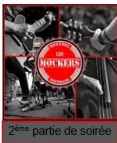
2 ème partie de soirée