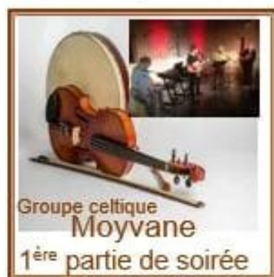
Groupe celtique Moyvane 1 ère partie de soirée

A partir de 19h30 à la salle polyvalente